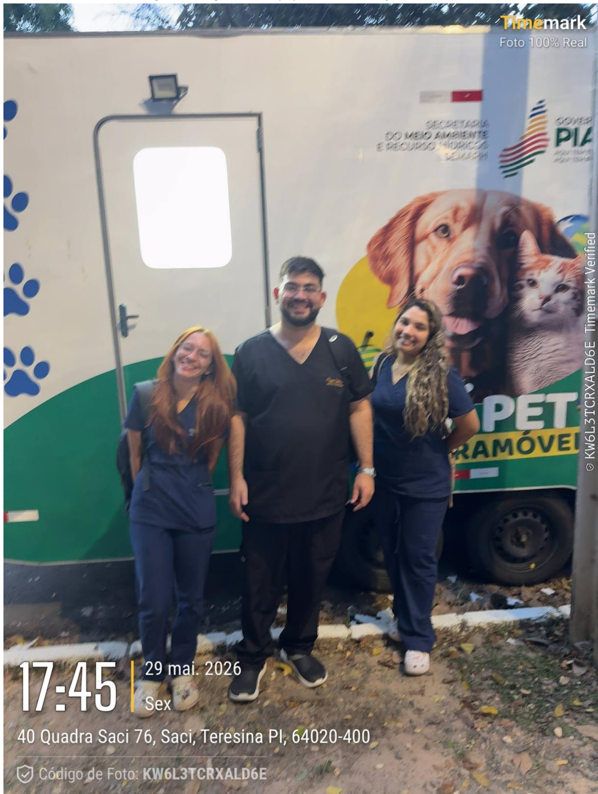
Figura 5. Registro de encerramento da ação no dia 29/05/26