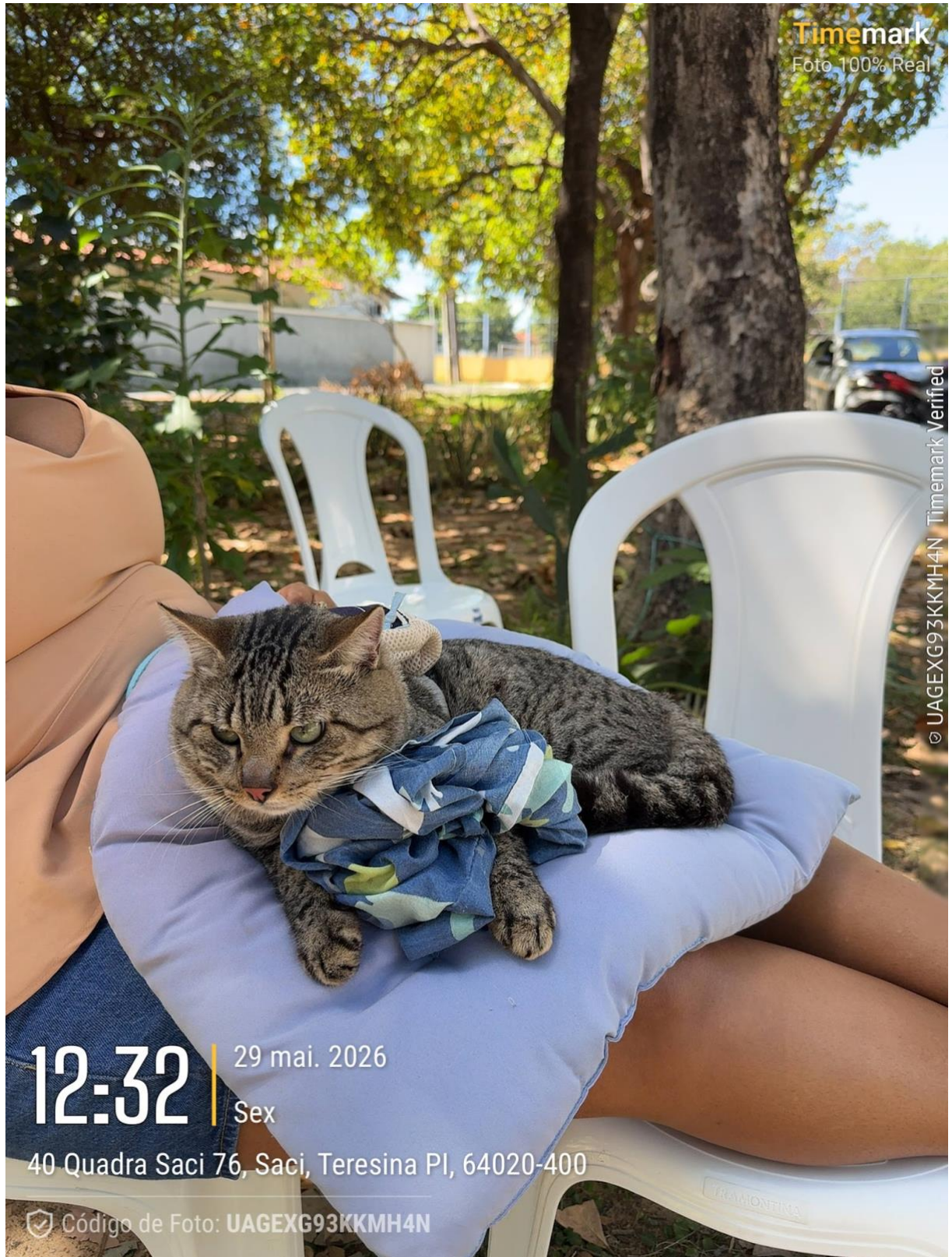
Figura 6. Registro da ação no dia 29/05/26