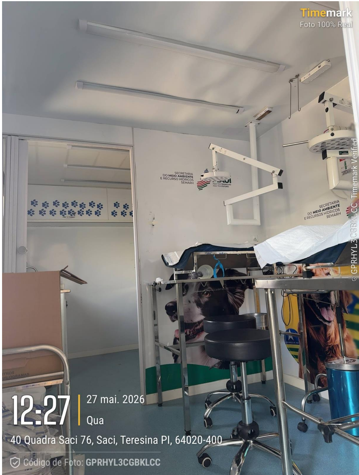
Figura 1. Registro da ação sem energia no dia 27/05/26