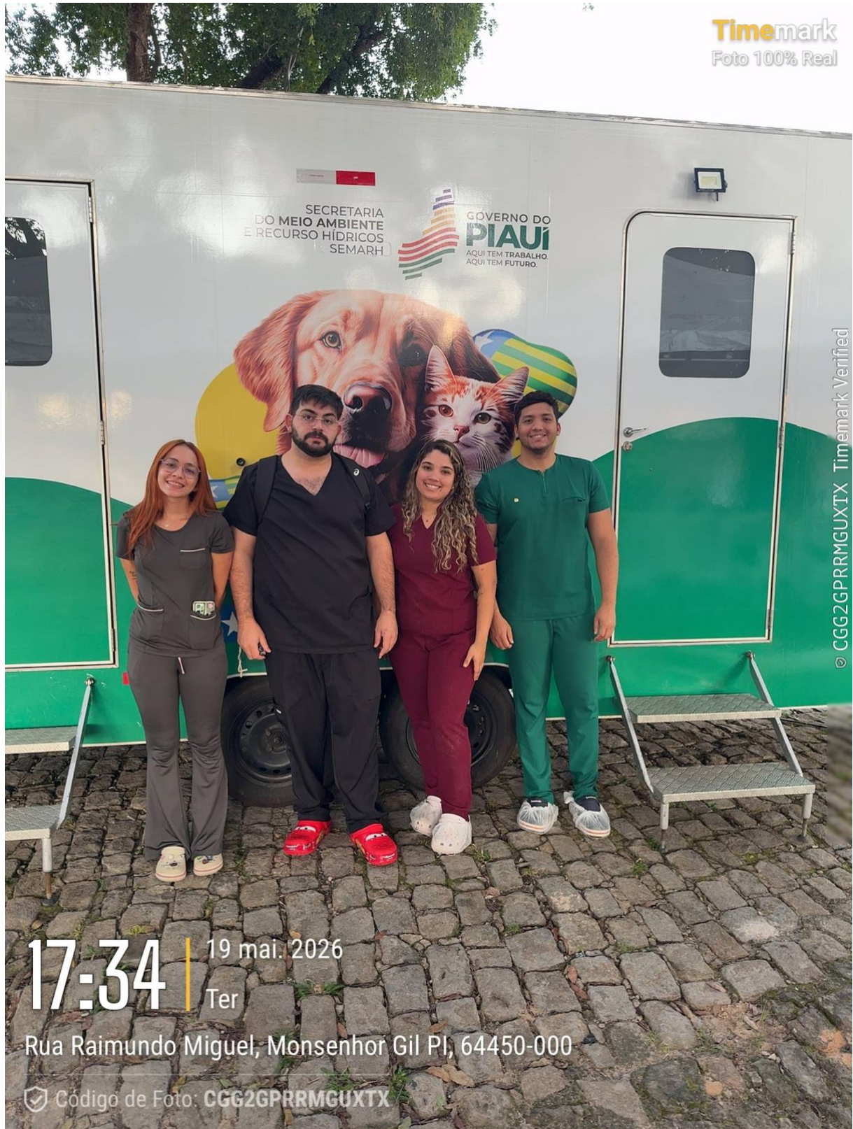
Figura 6. Foto do fim da ação no dia 19/05/26