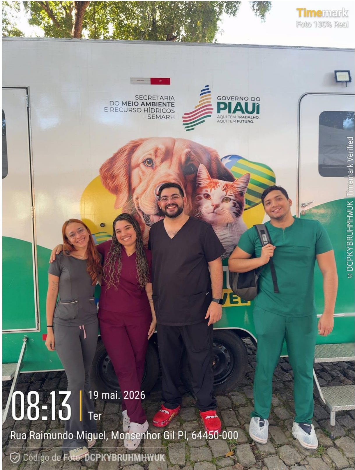
Figura 4. Foto de chegada da equipe na ação no dia 19/05/26