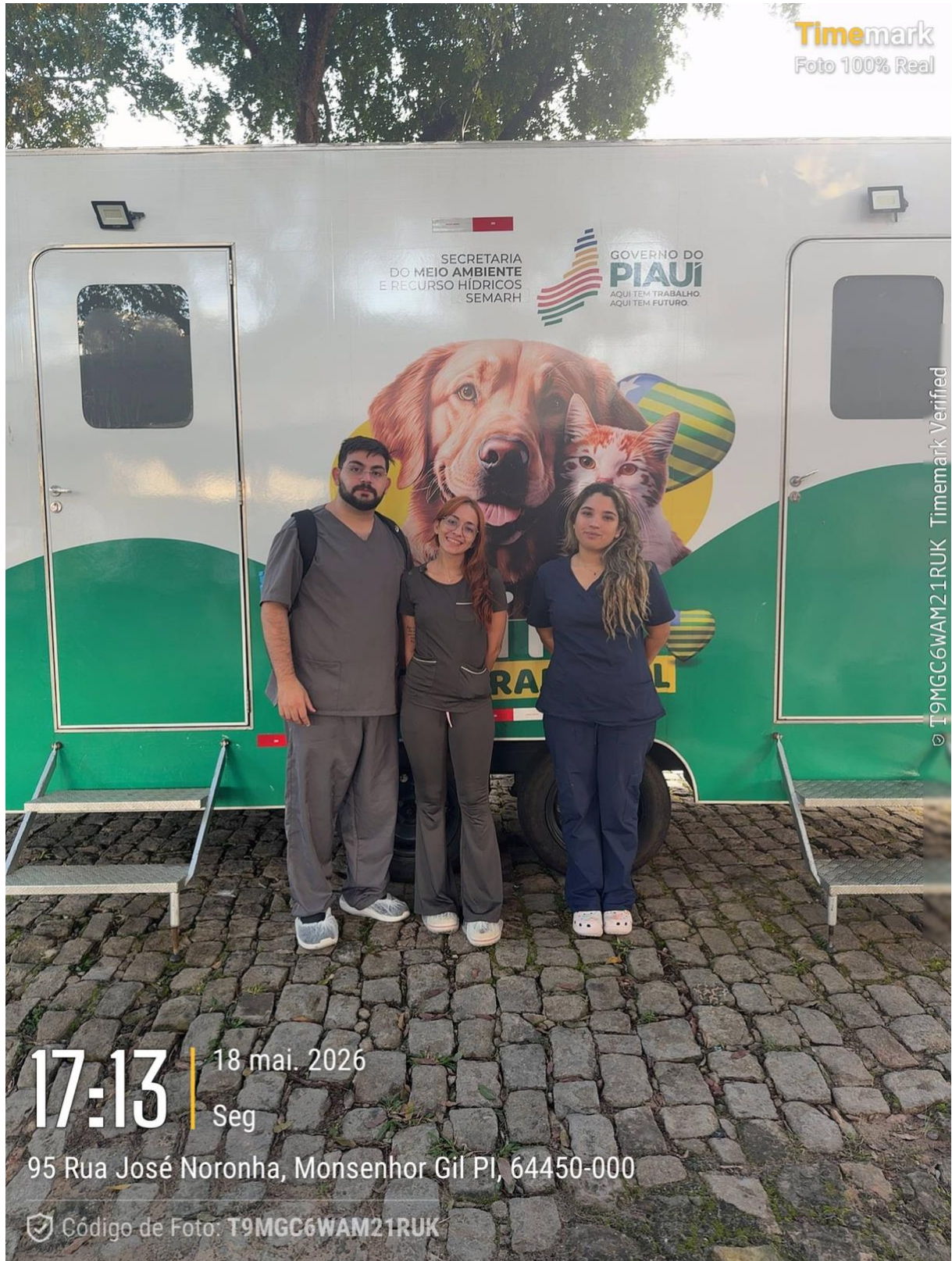
Figura 3. Foto de saída da equipe da ação no dia 18/05/26