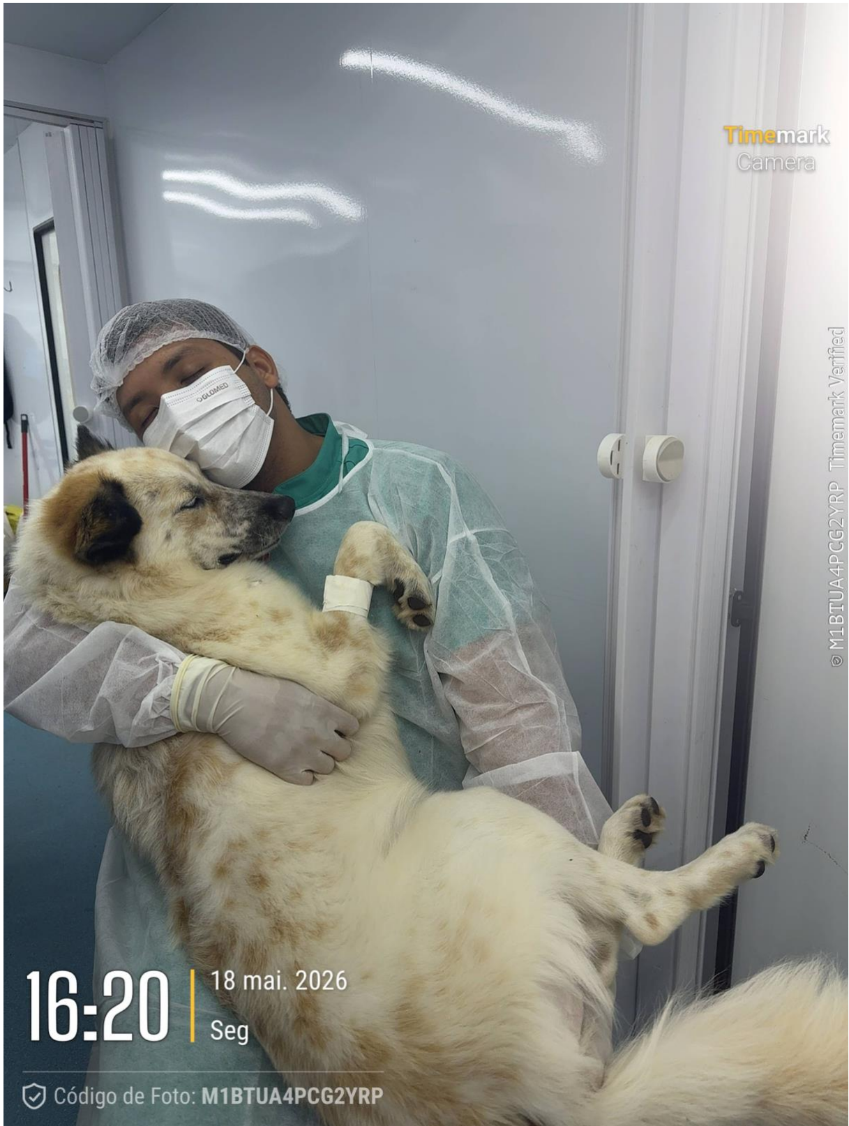
Figura 2. Foto da ação no dia 18/05/26