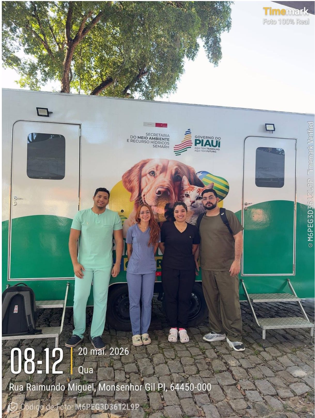
Figura 7. Foto do início da ação no dia 20/05/26