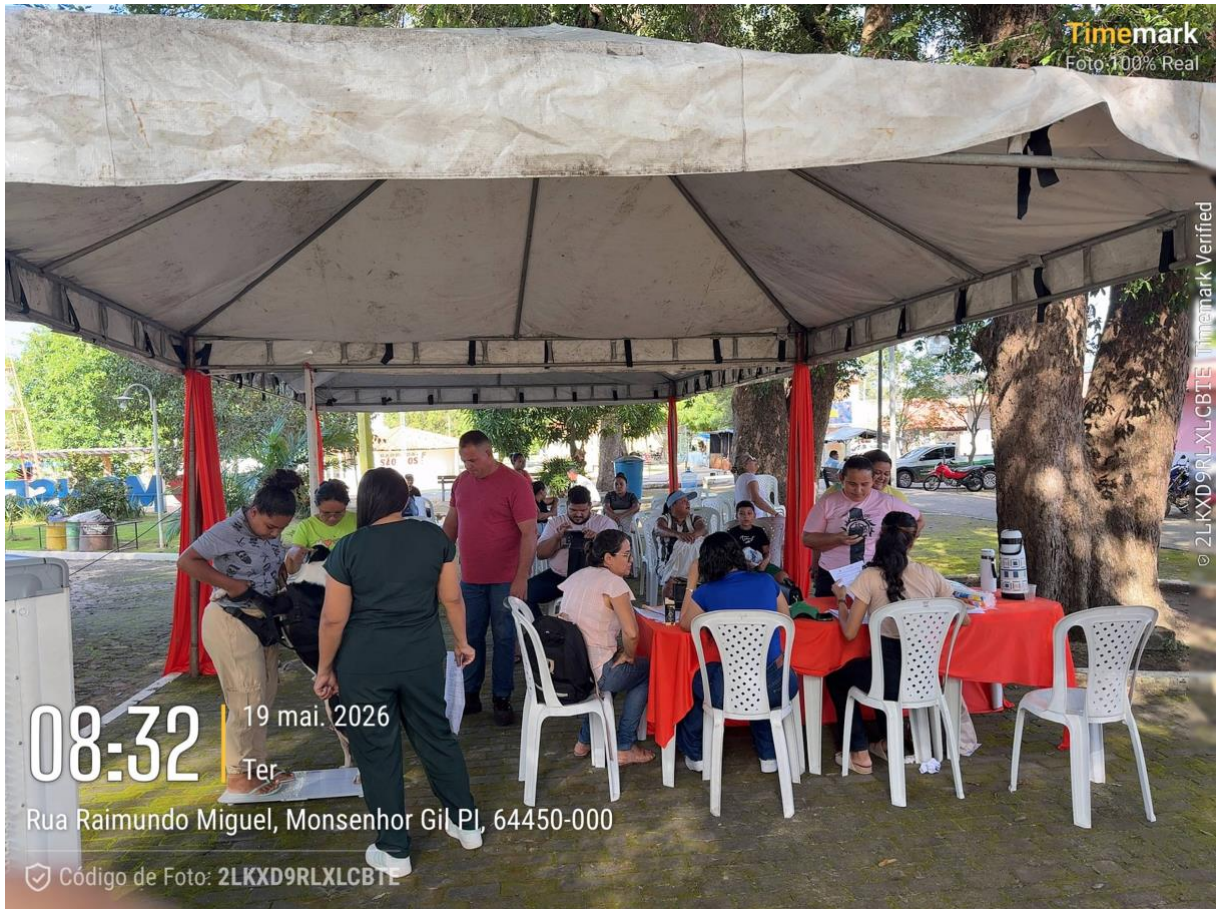
Figura 5. Foro da ação no dia 19/05/26