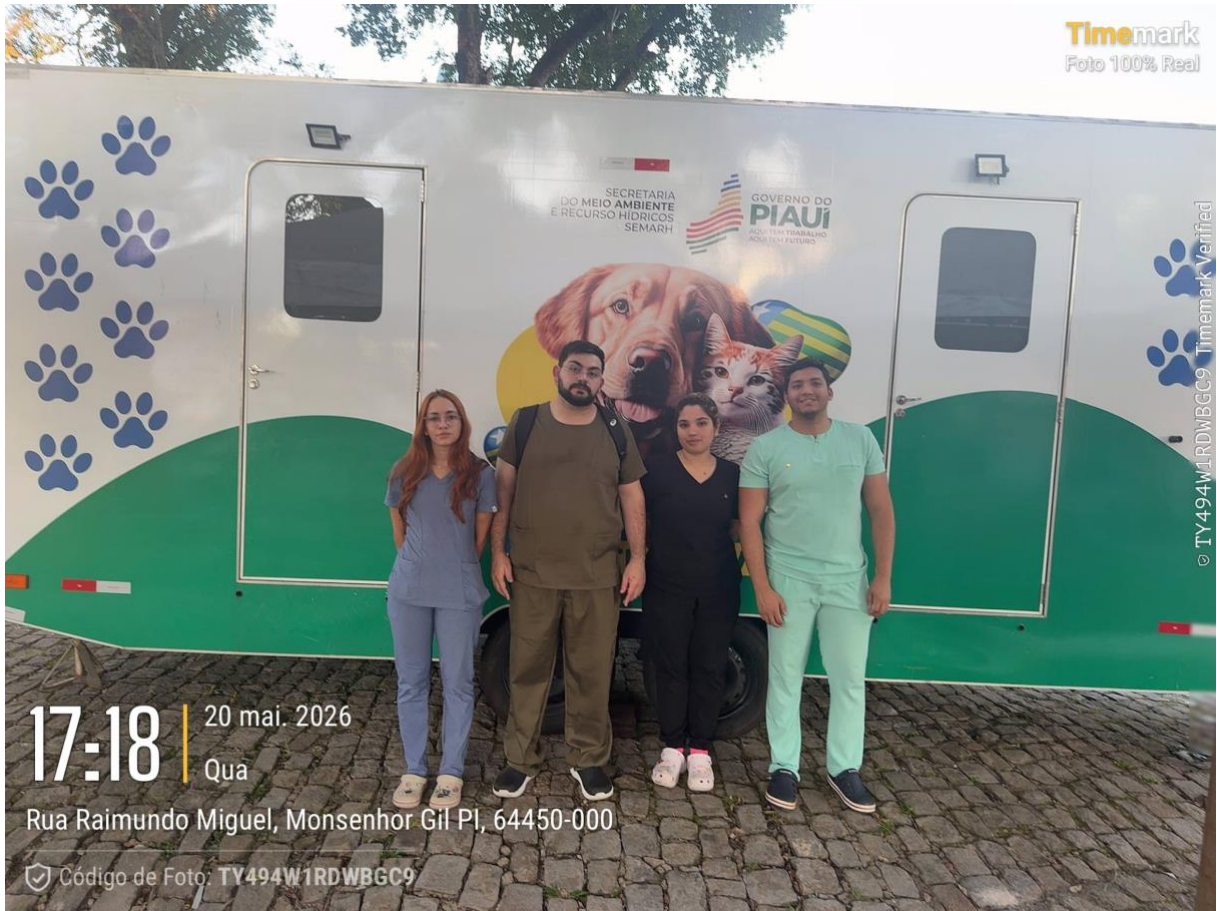
Figura 8. Foto de encerramento da ação no dia 20/05/26